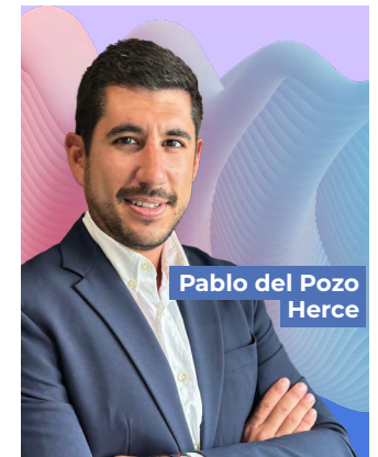
Pablo del Pozo Herce

Estudio descriptivo transversal con 42 estudiantes de tercer año de Enfermería durante el curso 2023-2024. Se utilizó la escala GAMEX y un cuestionario ad hoc para evaluar la experiencia del escape room. Más del 95% de los participantes estaban muy motivados. Las dimensiones de la escala validada GAMEX obtuvieron puntuaciones altas y la satisfacción general superó el 90%, demostrando disfrute y profundización en los aspectos clave de la asignatura.