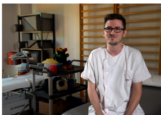
Rubén Fernández Matías Hospital Universitario Fundación de Alcorcón

Para ello, es necesaria la detección precoz de la plagiocefalia, cuya principal causa es la presión constante en ciertas áreas de la cabecita del bebé. A través de charlas educativas, talleres interactivos y materiales informativos, buscaremos concienciar a las familias sobre la importancia de adoptar medidas preventivas desde los primeros meses de vida de sus bebés y favorecer el desarrollo sensoriomotor.