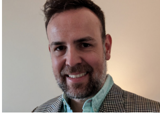
Juan Blanco Morillo Hospital Clínico Universitario Virgen de la Arrixaca / Universidad de Murcia