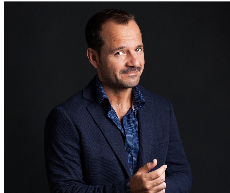
Ángel Martín Cómico, Guinista, Actor y Presentador

Recibe el premio Fuden Tv por su compromiso con la visibilidad de la salud mental y sus palabras de reconocimiento a enfermeras y profesionales sanitarios durante los momentos más duros de su vida personal.