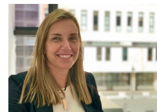
Leticia María Benítez Santana Hospital Universitario Doctor Negrín/ Universidad Fernando Pessoa

Este trabajo busca valorar, comparar y relacionar el dolor y estrés del niño en la venopunción mediante el método Distracción con Apego Koala (DAK) y método de contención física y evaluar el nivel de ansiedad percibido por los acompañantes en ambos grupos. Para ello, se ha llevado a cabo un ensayo clínico aleatorio simple ciego controlado de 220 participantes entre 3 y 4 años, que acudieron al servicio de urgencias pediátricas de un hospital de tercer nivel. Las variables de estudio fueron dolor y estrés del niño y ansiedad percibida por los acompañantes en ambos grupos previa y durante la técnica. Durante la técnica, la media de dolor y estrés en GCO y GIN fue de 5,64 \pm 3,3 y 3,87 \pm 3,01 ; 3,25 \pm 1,22 y 2,67 \pm 1,24 , respectivamente. No se hallaron diferencias estadísticamente significativas en la valoración de la ansiedad de los progenitores entre ambos grupos. Los pacientes sometidos a venopunción mediante DAK presentan un nivel de dolor y estrés inferior a aquellos que recibieron contención física y la ansiedad percibida por el acompañante es similar en ambos grupos.