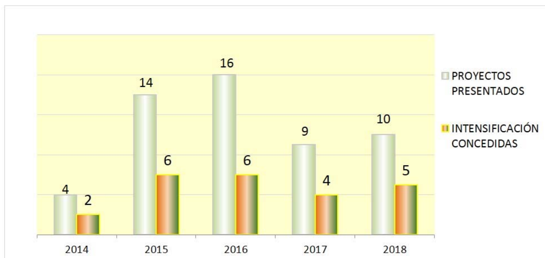
Gráfico 2. Número de profesionales que han solicitado y concedido becas de intensificación para desarrollo de proyectos de investigación enfermera.

La falta de tiempo del profesional para poder realizar la investigación, motivó una acción conjunta entre la Dirección del Instituto de Investigación y la Dirección de Enfermería del hospital, concretándose en la primera convocatoria de becas de intensificación para la investigación enfermera en el 2013. Esta ayuda para la investigación en cuidados, pionera en aquel entonces, ha permitido realizar 23 estudios de investigación en sus cinco convocatorias (graf.3)