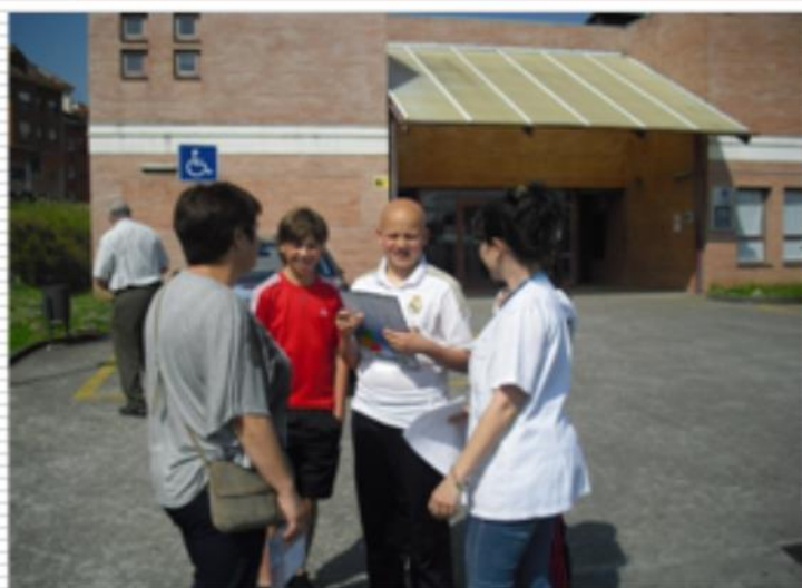
Encuesta sobre tabaco a los usuarios del centro de salud