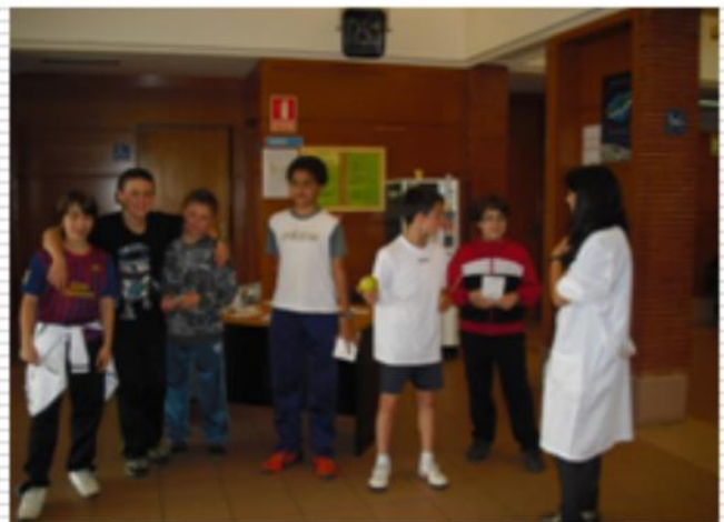
Intercambio de tabaco por manzanas