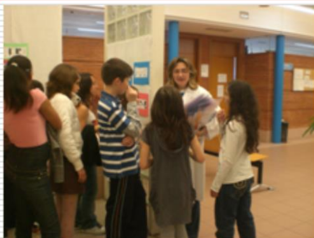
Diploma de reconocimiento