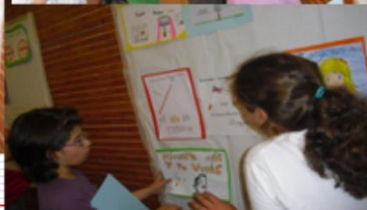
Decorando el Centro de Salud